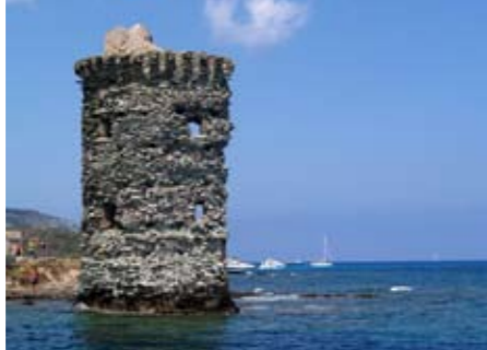
Die Wacht am Kap. Der uralte Turm von Agnello nahe dem Cap Corse