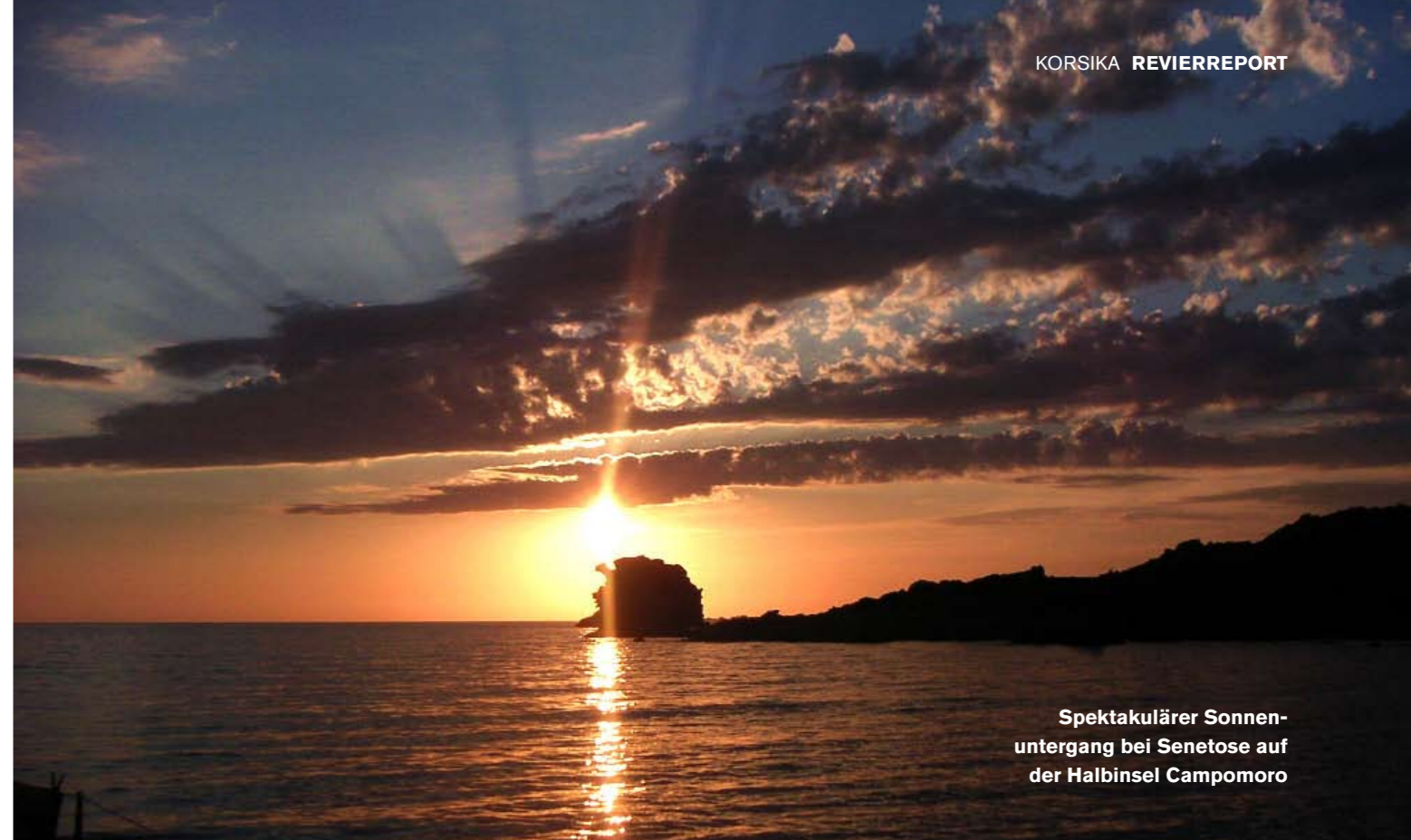
Spektakulärer Sonnenuntergang bei Senetose auf der Halbinsel Campomoro

Die nach Südwest offene 24 Cala Longa ist schmal und einsam. Der enge Schlauch ist von außen kaum zu sehen, die Einfahrt problemlos, wenn man in der Mitte bleibt.