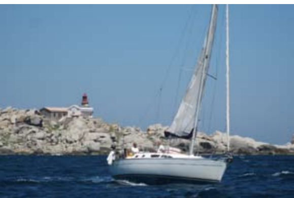
Segeln vor Lavezzi, der mit Granitblöcken übersäten Insel eingangs der Meerenge

Nächster Meilenstein ist 15 Bonifacio . Der Hafen versteckt sich wie in einem Fjord. Kurz vor der Ankunft auf Kanal 09 bei der Capitainerie anmelden. Ankommende Schiffe werden von einem Gummiboot empfangen und zum Liegeplatz geleitet. Wenn man keine Antwort bekommt, einfach reinfahren. Am besten ist ein Liegeplatz auf der Südseite, sonst gerät der Marsch in die Altstadt lang.