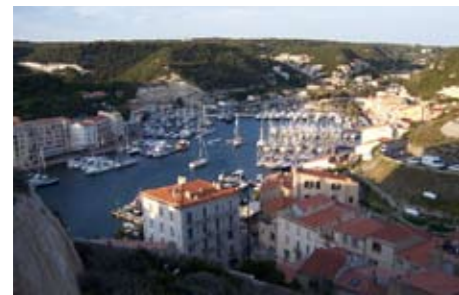
Abrahams Schoß. Blick hinab von der Altstadt auf den Hafen von Bonifacio