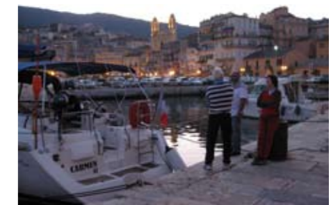
Bastia ist für viele Segler Starthafen oder aber erster Anlaufpunkt auf Korsika

Danach folgen einige tolle Buchten, etwa die 5 Anse de Carataggio südlich der Insel